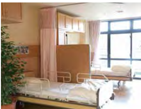
特別養護老人ホーム居室